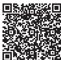
Finden Sie Ihre Partnerwerkstatt